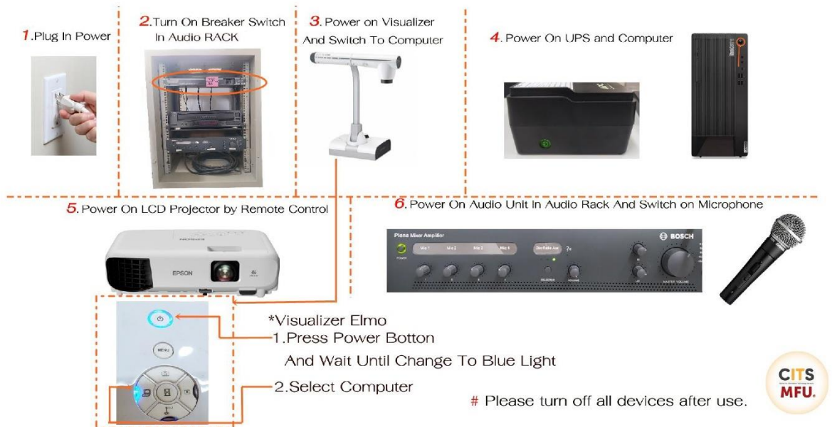
รูปแสดงการต่อพ่วงอุปกรณ์ภายในห้องเรียน แบบที่ 3